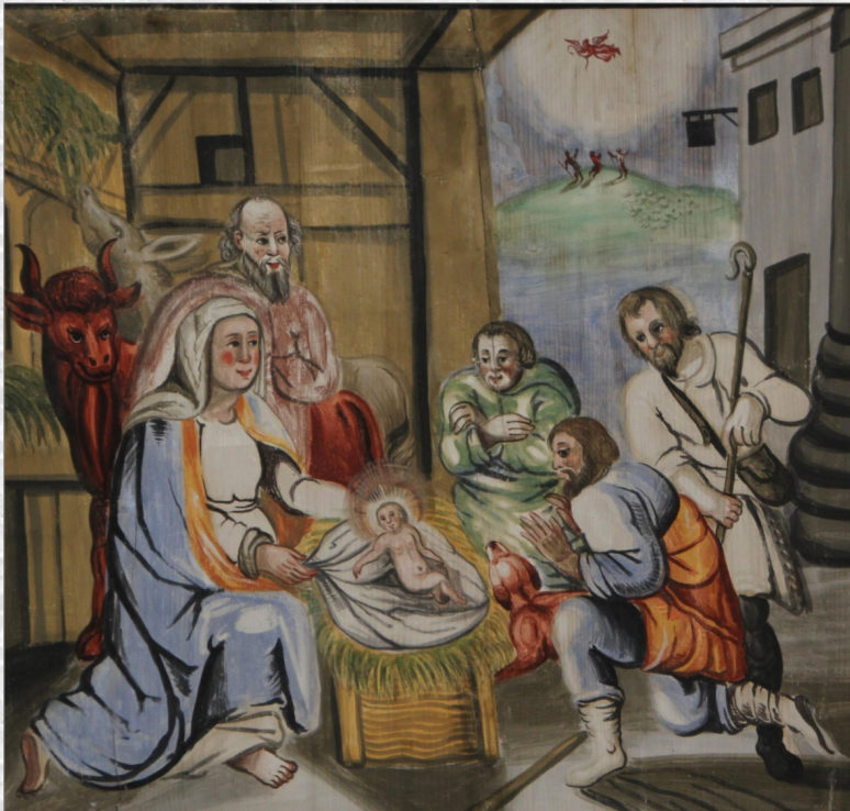
Bild: Decke der Blankensteiner Kirche

Mohorn – Herzogswalde – Blankenstein/Helbigsdorf Dezember 2021 – Februar 2022